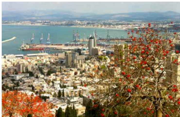
* Haven van Haifa.