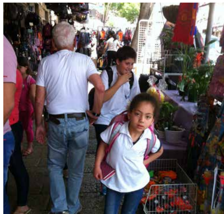
* Straatbeeld Nazareth in Galilea.