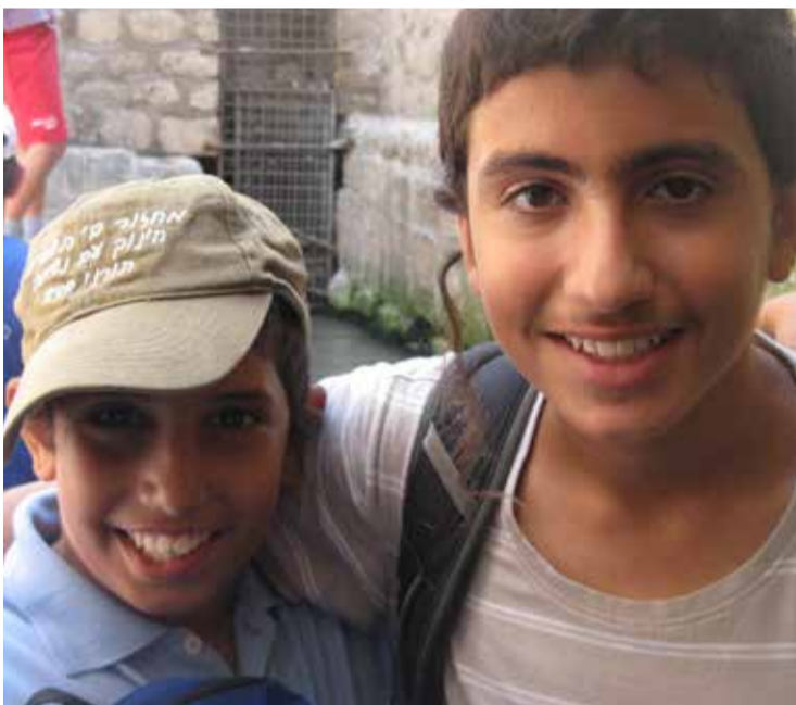
* Kinderen in Israël, opgevangen door de stichting LeChaim tijdens de vijftigdaagse oorlog in de zomer van 2014.

* Om ‘veiligheidsredenen’ is op verzoek van een aantal geïnterviewden hun familienaam gefingeerd.