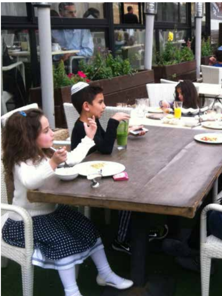
* De kuststad Netanya is een trekpleister voor toeristen maar ook voor veel Franse Joden die zich er vestigen omdat zij zich wegens steeds sterker worden antisemitisme in hun land niet meer veilig voelen.