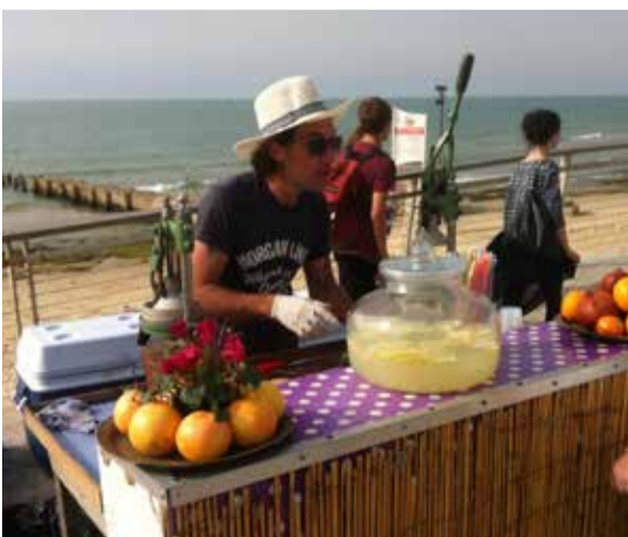
* Fruitverkoper op de boulevard van Jafa.

Kortom: de enige democratie van het Midden-Oosten heeft het zwaar. Desondanks en tegen de terreur in, blijft het land hopen op vrede.