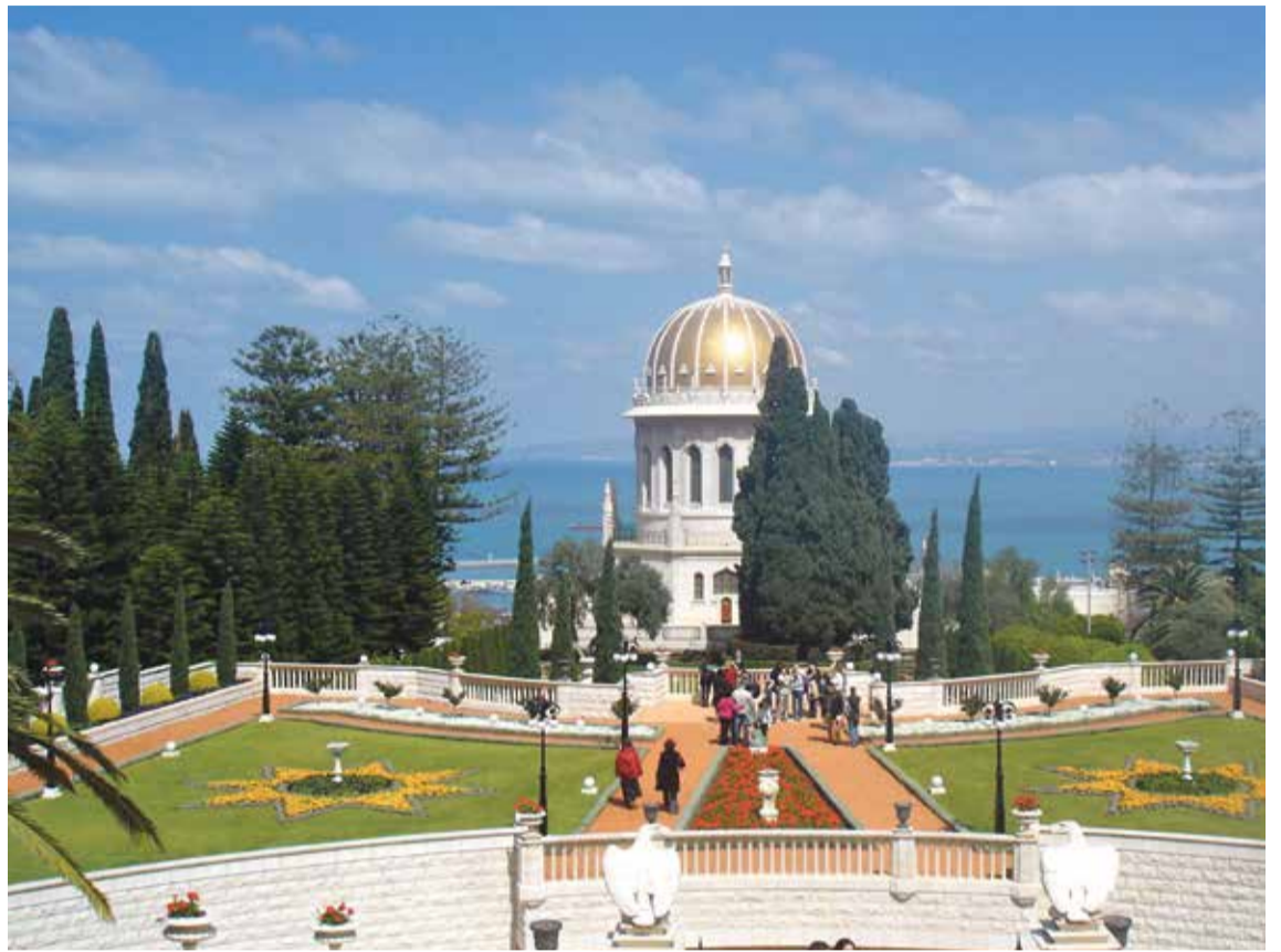
* De havenstad Haifa huisvest samen met het nabijgelegen Akko de hoofdzetel van de Bahá'í. Dit vanwege de godsdienstrijheid in Israël als enige land in het Midden-Oosten. Jaarlijks bezoeken meer dan een half miljoen mensen de beroemde Bahá'í-tuinen op de helling van de Karmelberg.

Toch zijn er voorbeelden van hoop op en bewijzen van vrede, in het land waar minstens tachtig verschillende culturen in vrijheid met elkaar omgaan. Een paar willekeurige voorbeelden. De joodse topkok Ottolenghi vormt met zijn Arabische vriend Sami Tamimi een succesvol duo dat wereldwijd culinaire successen boekt; een Arabisch-Israëliëse meisje werd via televoting Miss Israël; de voormalige president Olmert is door het hooggerechtshof onder voorzitterschap van een Israëlische Arabier veroordeeld tot de gevangenis en, recent: de dochter van een Hamas-leider uit Gaza is tijdens de wapenstilstand met het