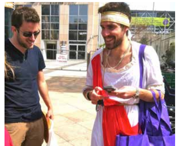
* Straatbeeld in Tel Aviv.

VERLANGEN NAAR VREDE VERLANGEN NAAR VREDE