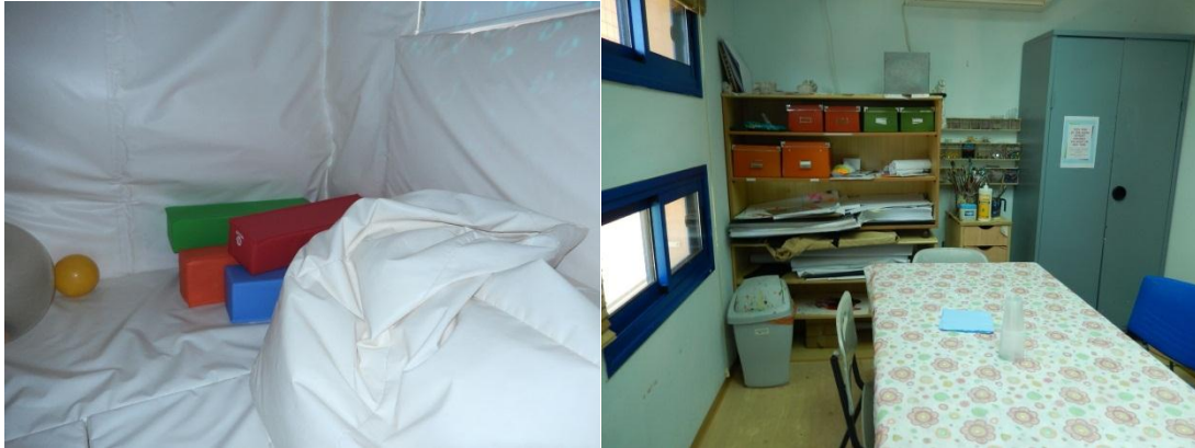
Snoozelkamer en creatieve ruimte

We bezochten dit centrum en kregen deskundige uitleg van de directeur en de muziektherapeut. De noodzaak van de verschillende vormen van behandeling behoeft niet veel nadere toelichting, als men zich realiseert dat kinderen volkomen dichtgeslagen kunnen zijn na het ondergaan of zien van iets verschrikkelijks. Door agressief gedrag, nachtmerries en/of bedplassen kan aan het licht komen dat zij hulp nodig hebben. Door spel, beweging, tekenen, muziek en omgang met dieren kunnen zij leren zich te uiten.