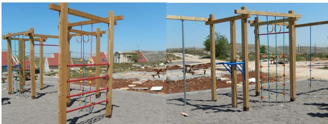
Speeltoestel van twee kanten bekeken

In maart 2011 werden Udi Fogel (37 jaar), zijn vrouw Ruth (36 jaar) en drie van hun zes kinderen: de tienjarige Yoav, hun zoontje van vier Elad en hun baby Hadas (drie maanden) gedurende de shabbatnacht op gruwelijke wijze met messteken om het leven gebracht in Itamar, een nederzetting op de Westbank, niet ver van Shiloh. De leden van het gezin werden in hun slaap overvallen door een terrorist. Ter nagedachtenis aan hen en andere slachtoffers is een begin gemaakt met de realisatie van het Park Fogel. Hier kunnen de helaas vaak getraumatiseerde kinderen spelen, zodat zij de spanningen en het verdriet even kunnen vergeten. Er staat al een prachtig speeltoestel. Ook staan er tafels en banken, waaraan de families kunnen picknicken. Stichting LeChaim steunt ook dit mooie initiatief financieel.