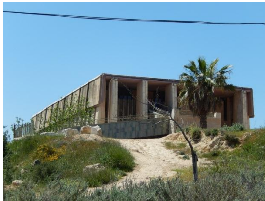
Synagoge Shiloh: uiterlijk van de Tabernakel